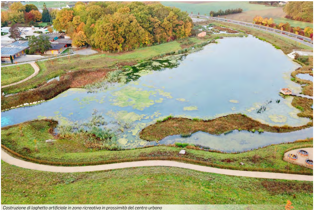
Costruzione di laghetto artificiale in zona ricreativa in prossimità del centro urbano