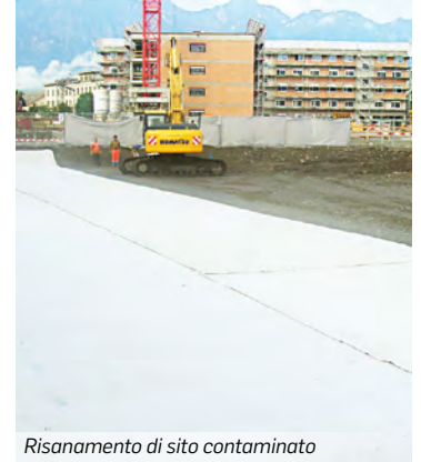
Risanamento di sito contaminato