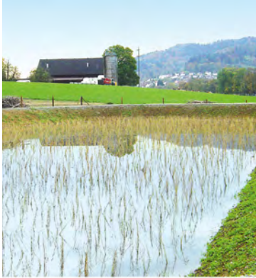
Bacino di ritenzione e filtrazione