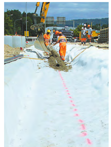
Impermeabilizzazione di perimetri