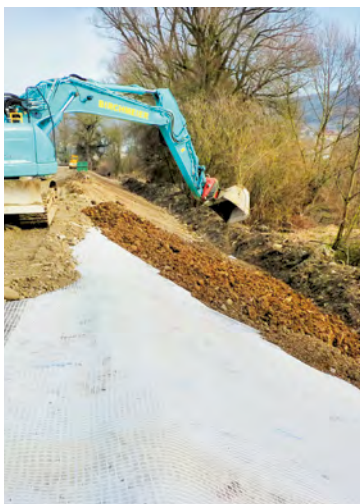
Argine di protezione contro piene del fiume