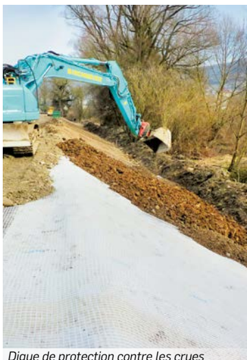
Digue de protection contre les crues