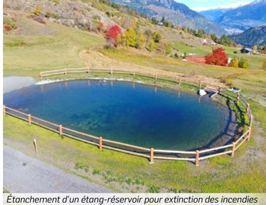
Étanchement d'un étang-réservoir pour extinction des incendies