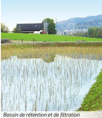
Bassin de rétention et de filtration