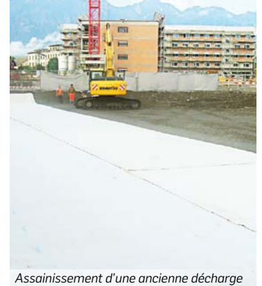
Assainissement d'une ancienne décharge