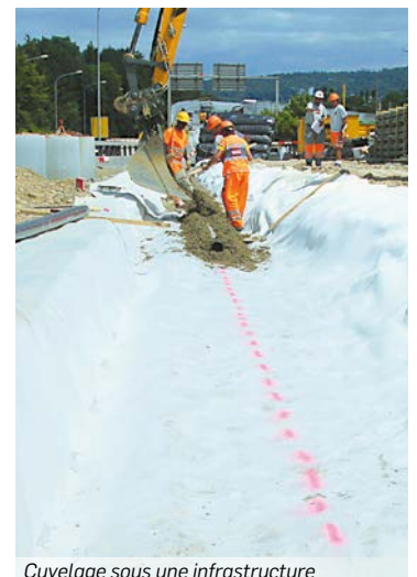
Cuvelage sous une infrastructure