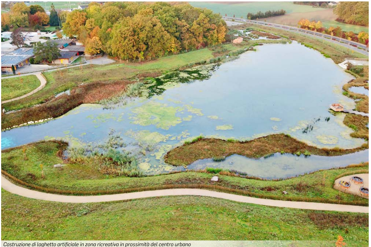
Costruzione di laghetto artificiale in zona ricreativa in prossimità del centro urbano