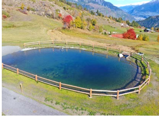
Impermeabilizzazione di bacino antincendio