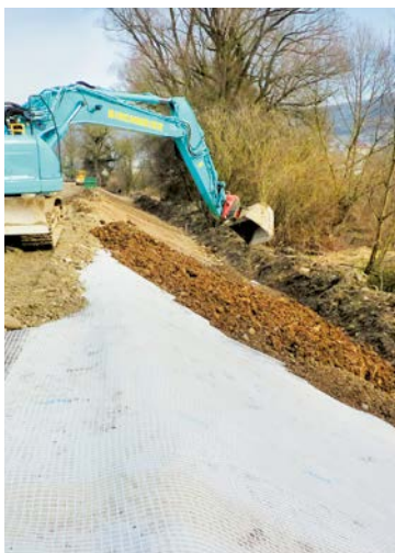
Argine di protezione contro piene del fiume