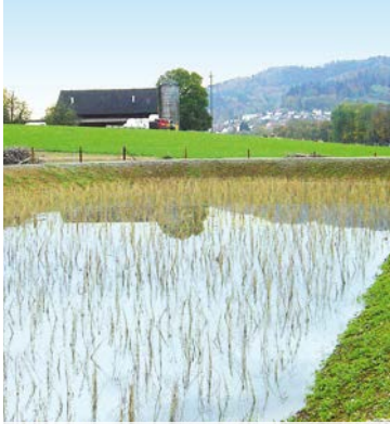
Bacino di ritenzione e filtrazione