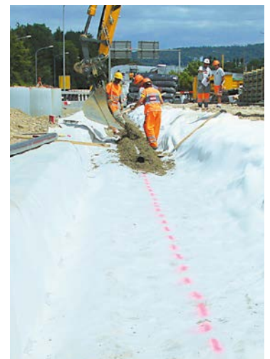
Impermeabilizzazione di perimetri