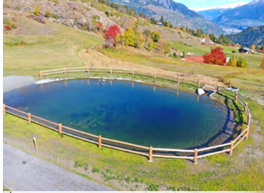
Étanchement d'un étang-réservoir pour extinction des incendies