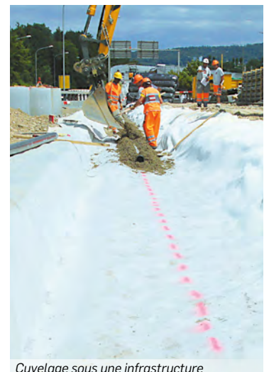
Cuvelage sous une infrastructure