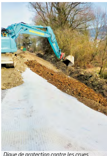
Digue de protection contre les crues